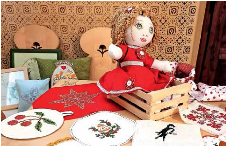
Delavnice Ljudske univerze Škofja Loka