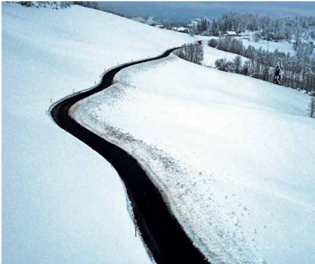
Na novo asfaltiran odsek ceste Preskar–Jezeršek v dolžini okrog sedemsto metrov

Na drugih cestah so bile nasute bankine, kjer je bilo potrebno, na makadamskih cestah pa so bile predvsem zasute udarne jame. S pomočjo občinskih sredstev je bil saniran in na novo asfaltiran odsek lokalne ceste Trebija–Stara Oselica v dolžini 630 metrov od odcepa Jezeršek do zvona pri Ermanovcu. Skupaj s krajani smo sodelovali tudi pri čiščenju in obsekovanju lokalne ceste Fužine–Kladje. Postavili smo tudi nekaj novih prometnih znakov. V športnem parku na Trebiji smo na asfaltne igrišču obnovili tankoslojne označbe za košarko, ki so zarisane v rumeni barvi. Na novo so se zarisale tudi