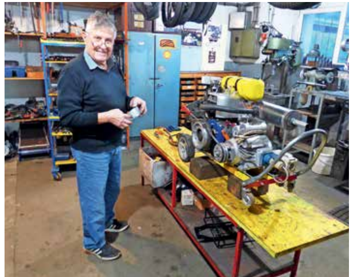
Edo pri izdelavi agregata za električno energijo

čas zapolnili motorji. S tekmovanj doma in v tujini je prinesel več kot dvesto pokalov in kristalno čelado za petkratno osvojitve državnega prvenstva v kategorijah prikolic in 350 ccm. Ker je udeležba na tekmovanjih, kjer se plačuje štartnina in vzdrževanje tekmovalnih motorjev, drago, si je kak dinar prislužil s tem, da je drugim tekmovalcem popravil njihove motorje. Njegov zadnji dosežek pa je enofazni agregat za elektriko na bencinski pogon, zmogljivosti 2 kW, ki ga je izdelal iz motorja BCS kosilnice in drugih rezervnih delov, nekaj jih je izdelal tudi sam na stružnici. Morda mu bo prišel prav ob električnem mrku, če bo prehuda energetska kriza ali pa žledolom, še doda.