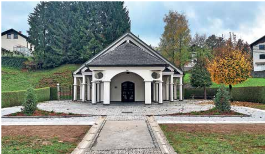
Urejena je bila okolica poslovnega objekta v Gorenji vasi.

Na javni poti Volaka–Čabrače v dolžini 450 metrov se je zamenjal asfalt in uredila drenaža. Investicija je bila vredna približno 46 tisoč evrov. Zaradi pozne sklenitve pogodbe z izvajalcem asfaltiranja se bo sanacija lokalne ceste Gorenja vas–Žirovski Vrh v dolžini 570 m izvedla letos. Vse leto se je izvajalo tudi redno vzdrževanje lokalnih cest in javnih poti.