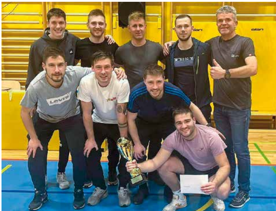
Zmagovalna ekipa Lučinski Farani

Kot je povedal Domen Homec iz Športnega društva (ŠD) Sv. Urban, ki je organiziralo turnir, tega ni bilo niti v času gradnje nove športne dvorane. Še v stari šolski športni dvorani so zaradi prostorskih razmer igrali na male gole, v novi dvorani pa po klasičnih futsal pravilih 4+1. Letos je sodelovalo šestnajst ekip, katerih člani so prišli iz Poljanske doline, Selške doline, Žirov, Idrije, okolice Ljubljane in celo ekipa iz Izole. Na turnirju, ki je potekal cel dan, se je na tribunah zbralo lepo število gledalcev in navijačev. Zmago na turnirju za leto 2022 je dosegla ekipa z imenom Lučinski Farani, ki je v razburljivem finalu z rezultatom