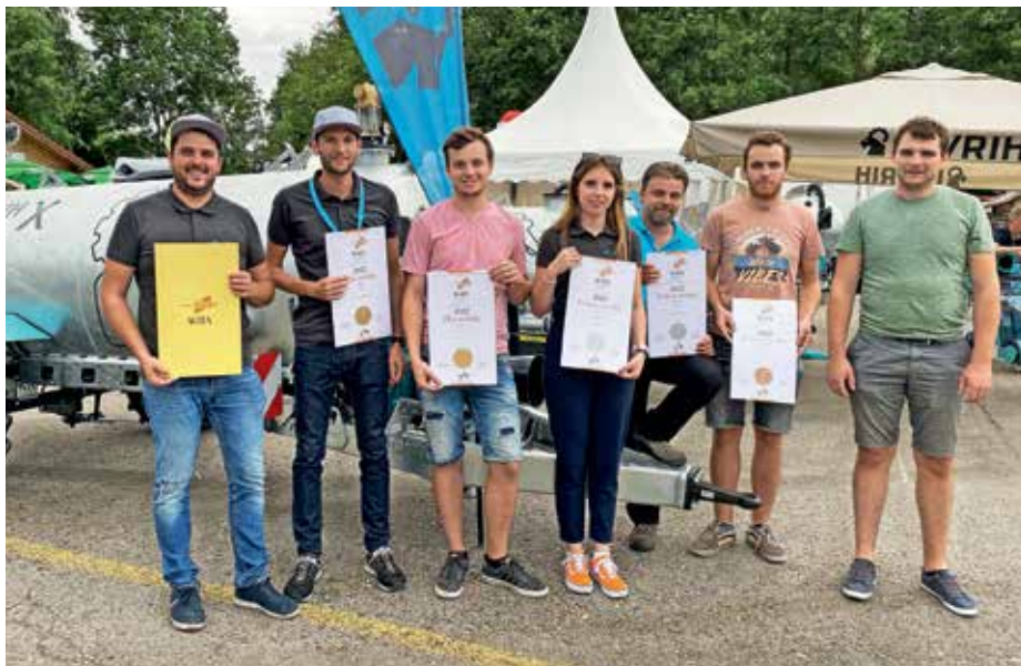
Na sejmu Agra je bilo nagrajenih pet Lavrihovitih strojev.

Nagrajeni produkti so že v redni proizvodnji. Proizvodnja koles za gorske kosilnice je v načrtu, ko se bodo preselili v nove poslovne prostore. Pri kupcih je najbolj priljubljen pobiralni zgrabljalnik AlpFlow, ki je že v serijski proizvodnji. »Veliko časa in denarja smo vložili v vodenje in optimizacijo proizvodnje, s katero smo povečali redno proizvodnjo za 40 odstotkov z enakim številom ljudi. Prodajna ekipa ima zato več dela, da proizvodnja stalno teče. Za zagotavljanja najvišje možne kakovosti proizvodov smo v letošnjem letu pridobili in uspešno vpeljali tudi standard ISO 9001.« Težav s proizvodnjo in montažo nimajo, saj so stroji konstruirani modularno, a so odvisni tudi od pravočasnih in kakovostnih dobav dobaviteljev. Letos bodo vpeljali nov informacijski sistem ERP&PLM, ki bo