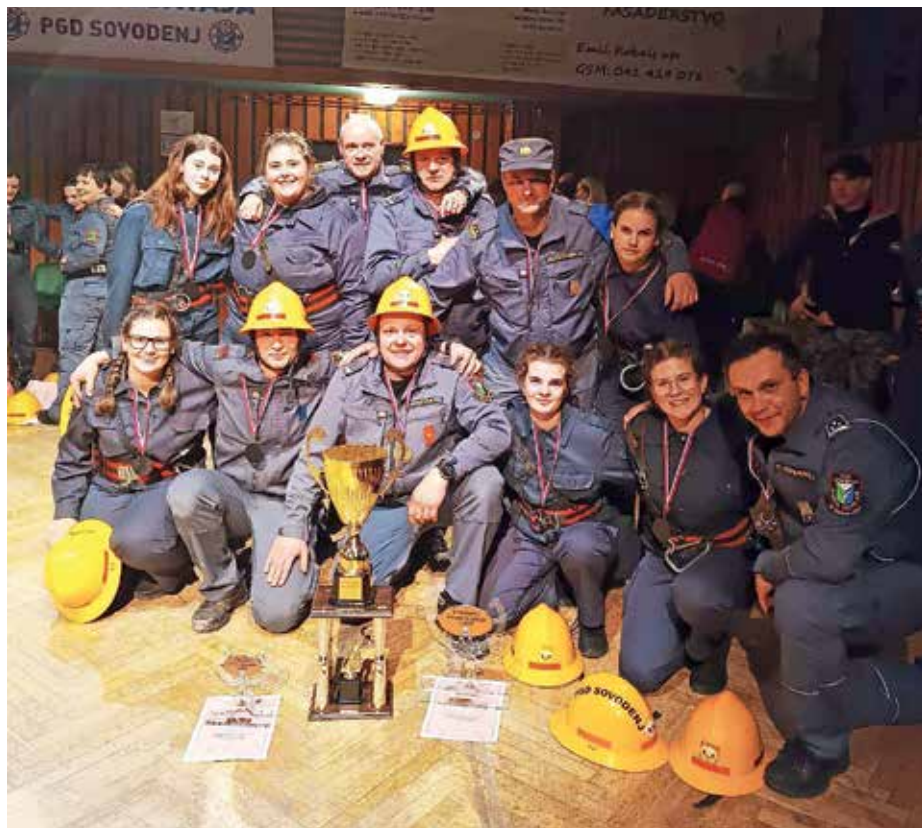
Članice in člani PGD Sovodenj na zmagovalnih stopničkah