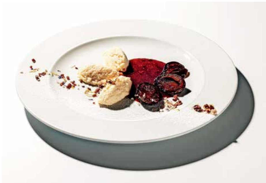
Gostilna Lipan

Menija gostilne Lipan: česnova juha, svinjska ribica z jurčkovo peno, domači ravioli in zdrobovi žličniki s slivovo omako in Taverne Petra: pozdrav iz kuhinje, rezine dimljenega govejega jezika na posteljici rukole, hrenov zos, črna redkev, kozji sir, svinjski file z jurčki, skutin štrukelj, zeliščni ocvrtek ter teranova hruška v karamelni omaki s cimetom sta bila sestavljena na osnovi lokalnih sestavin, ki so na voljo v času festivala.