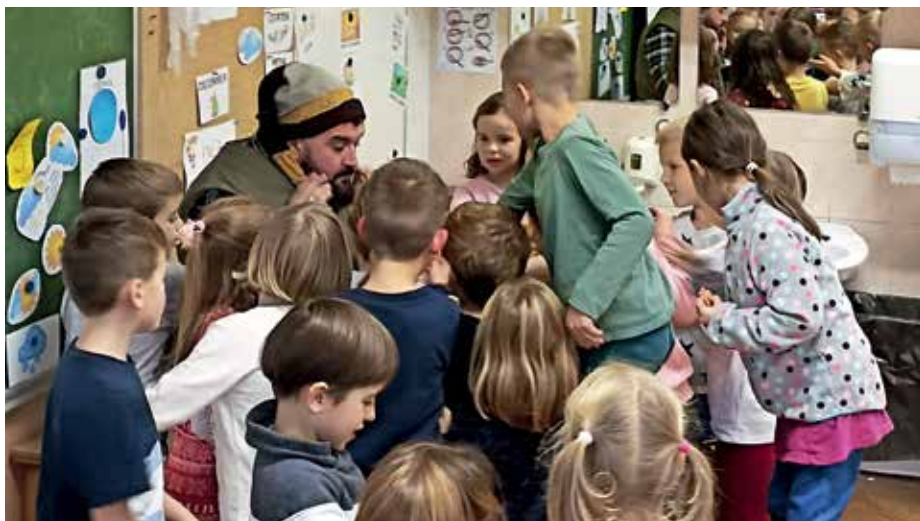
Škrat Zlobko med učenci podaljšanega bivanja

Vsem želimo srečno in čim bolj zdravo leto 2023, šoli pa, da se bo tudi pod sedmim ravnateljem oz. sedmo ravnateljico v šolski stavbi na Trati odvijalo kakovostno in napredno vzgojno-izobraževalno delo.