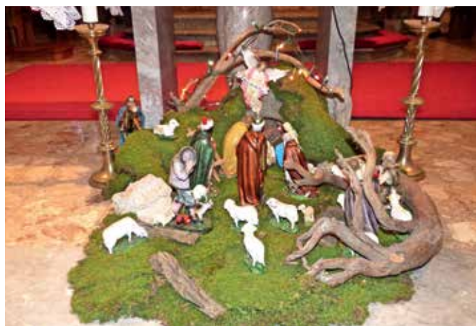
Jaslice v župnijski cerkvi sv. Urha v Leskovici so majhne, a slikovite.