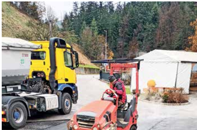
Asfaltiranje v središču Sovodnja

Na področju prometne infrastrukture je bil z občinskimi sredstvi urejen okrog 700 metrov dolg odsek lokalne ceste Stara Oselica–Ermanovec (od kapelice na Škrbinovem griču do Kmetije Sivkar), obnova omenjene ceste do Sovodnja se bo nadaljevala letos. Poleg rednega letnega vzdrževanja lokalnih cest in javnih poti so bili z asfaltno prevleko na novo urejeni 300-metrski odsek javne poti Sovodenj–Podosojnice, 220-metrski odsek lokalne ceste Sovodenj–Cerkljanski Vrh, 60-metrski odsek javne poti Grapa–Kalar–Jeram in 115-metrski odsek javne poti