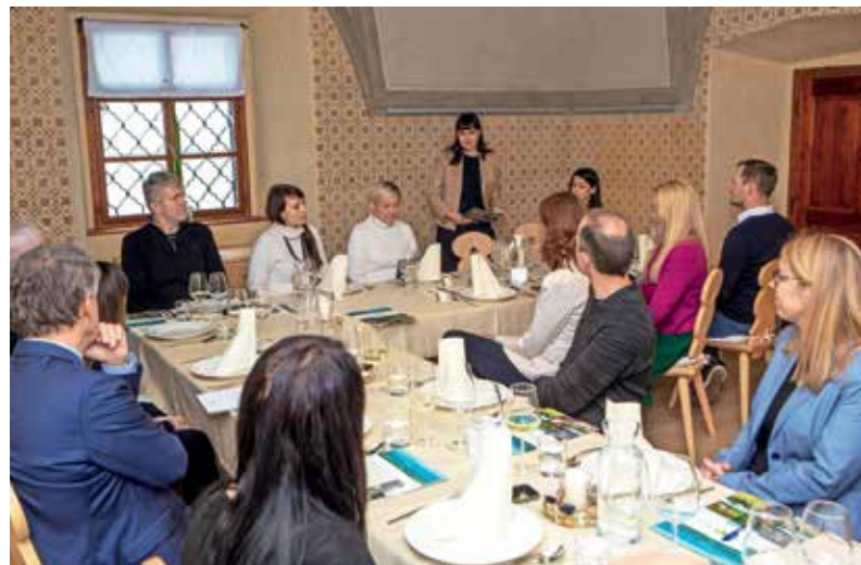
Ustanovna seja programskega odbora za organizacijo dogodkov v sklopu Tavčarjevega leta