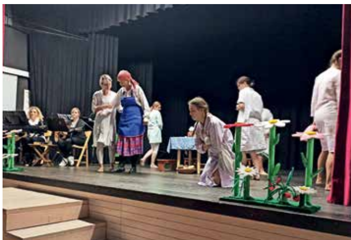
Vzgojiteljice iz Vrtca Žiri so zaigrale predstavo z naslovom Kdo je napravil Vidku srajčico.