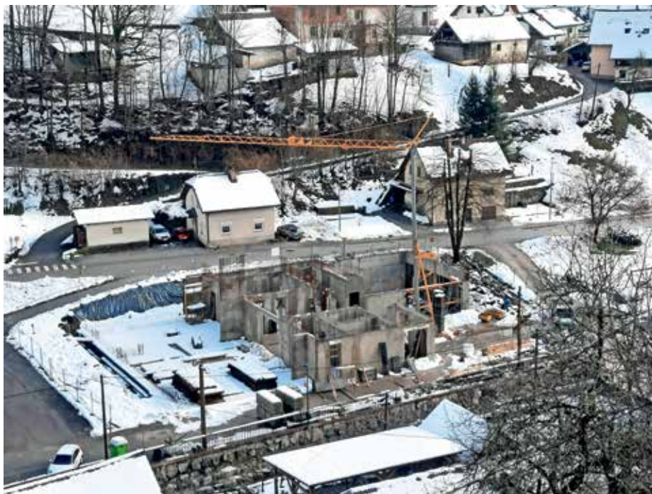
Gradnja novega kulturnega doma v Poljanah

V novembru smo začeli obnovo ceste na Kupšušu, kjer smo v cesto vgradili cevi za optiko in elektriko, obnovili meteorni jašek in zamenjali že razpadajoče betonske cevi za meteorno vodo v dolžini okrog 25 metrov. Zgrajen je bil kamniti oporni zid v dolžini 30 m. Na odseku ceste Hotovlja–Hotovnik se je čez potok Hotoveljščica razširil in na novo asfaltiral most. Sredstva smo namenili tudi za vzdrževanje številnih javnih cest in poti v naši krajevni skupnosti. Z občinskimi sredstvi pa smo lani začeli obnovo lokalne ceste Polycom–Palir. Na odseku ceste v dolžini več kot 300 metrov se bo v celoti zamenjal spodnji ustroj, vgradile se bodo cevi za optiko, elektriko in javno