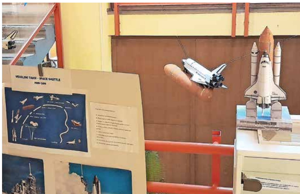
Vesoljski taksii

A1 Slovenija je v sodelovanju z zavodom Varni internet našim učencem ponudil