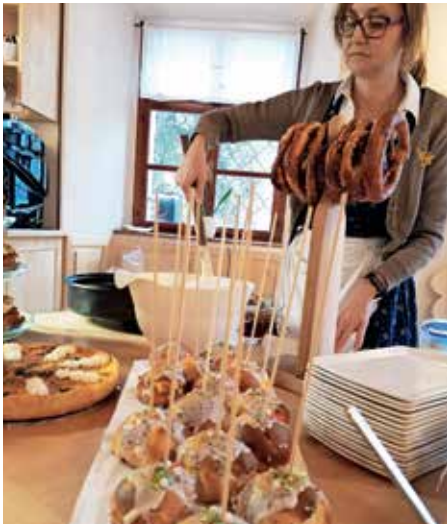
Kulinarika v Dvorcu Visoko