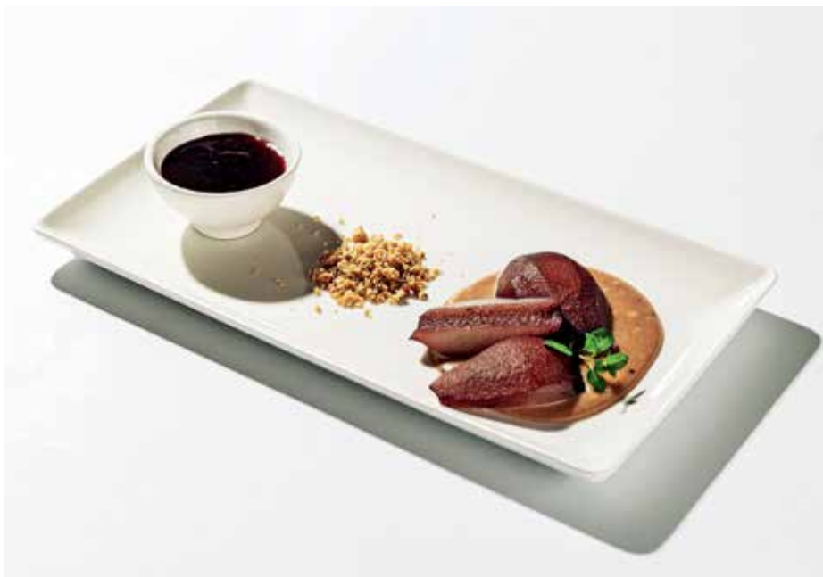
Taverna Petra

in Taverni Petra tudi sicer uporabljajo lokalne sestavine pri vsakodnevni pripravi jedi. Veseli so, da so tekom priprav na festival spoznali nove ponudnike, s katerimi bodo sodelovali v prihodnje. Želijo si, da gostje ob obisku njihovih gostiln in uživanju hišnih specialitet ter drugih jedi začutijo in okusijo tudi paleto lokalnih