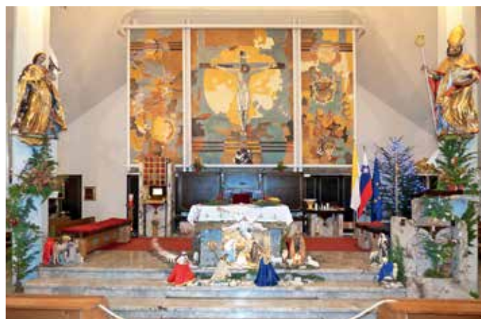
V poljanski župnijski cerkvi sv. Martina so letos figure oblekli v oblačila iz tekstila, jih razpostavili po prezbiteriju in jih simbolično povezali s tabernakljem.